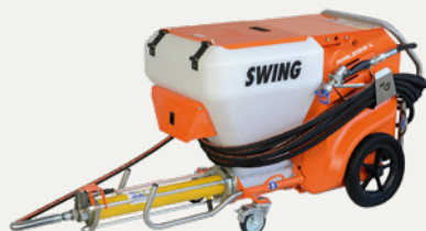
PFT SWING AIRLESS

Für die Verarbeitung mit Airless-Geräten von Spritzspachtel Plus eignen sich Airless-Geräte, deren Leistung auf die Verarbeitung von pastösen Spachtelmassen ausgelegt ist (z. B. Knauf PFT Swing Airless, Graco Mark V, VII, X, Wagner HC).