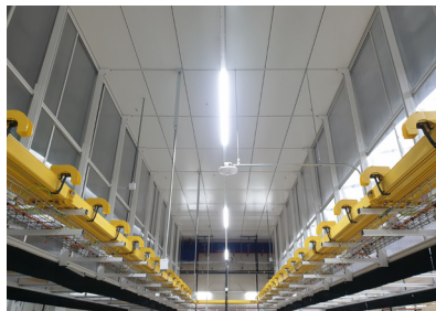
Logos Pure Data Center