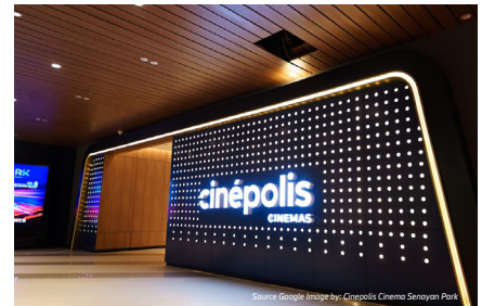
Cinepolis Senayan Park