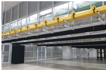
Logos Pure Data Center