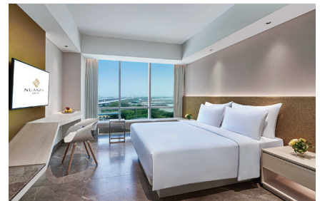
Nuanza Hotel & Convention Cikarang