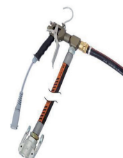
420058 Zargomat pro

Constructieve, statische en fysische eigenschappen van de Knauf systemen worden gewaarborgd op voorwaarde dat uitsluitend gebruik wordt gemaakt van de onderdelen van de Knauf systemen en de door Knauf speciaal aanbevolen producten.