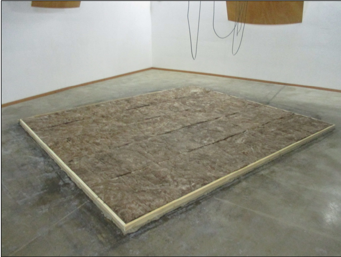
Fotografia dell'oggetto Photograph of item