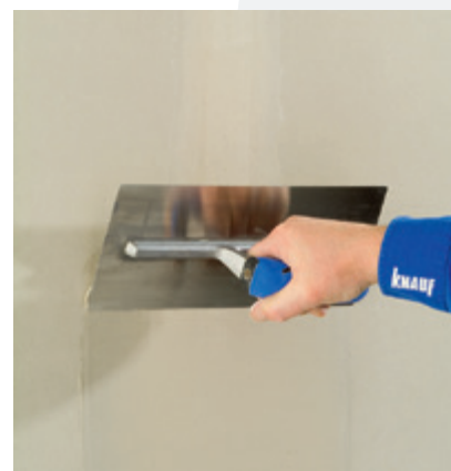
Knauf fireboard Spachtel para a placa Fireboard