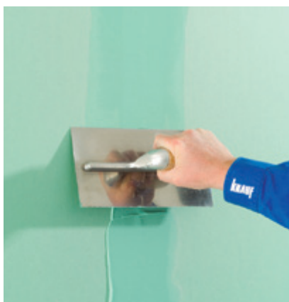
Knauf Uniflott hidrófugada para placas hidrófugas