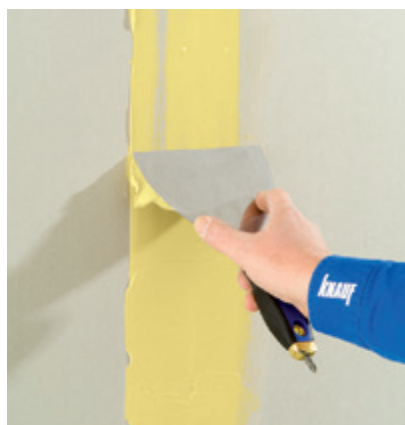
Knauf safeboard de cor amarela para a placa Safeboard