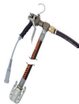
420058 Zargomat pro