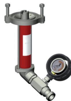
613021 B4-2 (rechtsdraaiend)