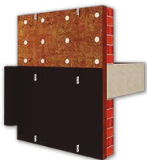
Sistema Rainproof de fachada ventilada