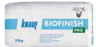
BioFinish PRO завршна глет маса