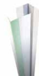
Кнауф Dallas аголни лајсни