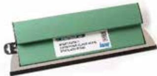
Кнауф системска глетарка