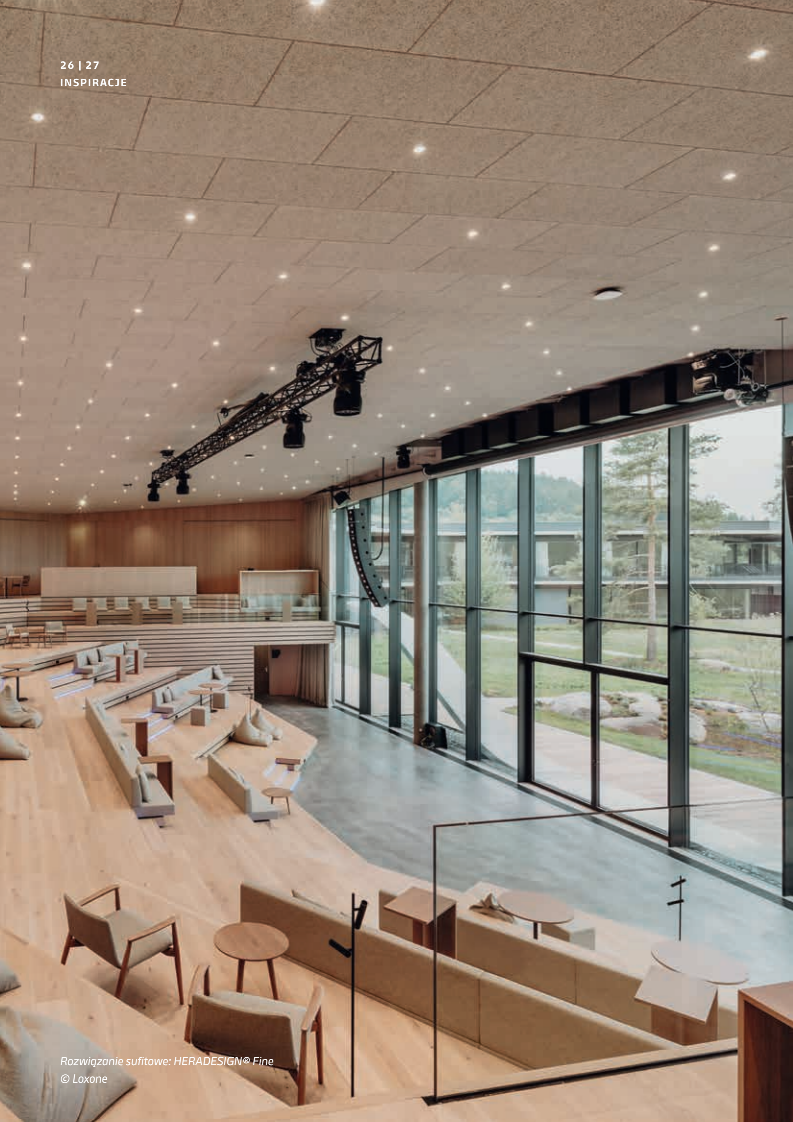
Rozwiązanie sufitowe: HERADESIGN® Fine