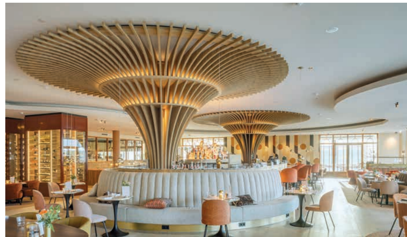
Rozwiązanie sufitowe: Seamless Acoustics