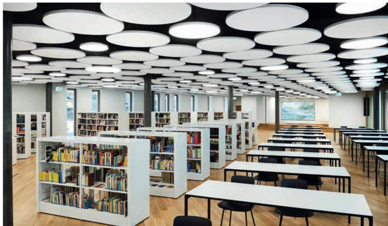
Rozwiązanie sufitowe: MINERAL Sonic Element