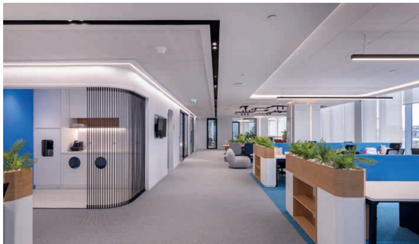
Rozwiązanie sufitowe: AMF THERMATEx® Alpha HD, MINERAL Sonic Element, DANOLINE Corridor