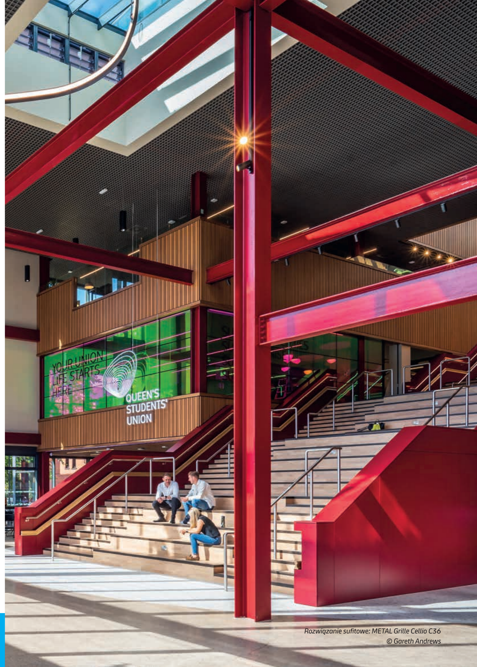
Rozwiązanie sufitowe: METAL Grille Cellio C36