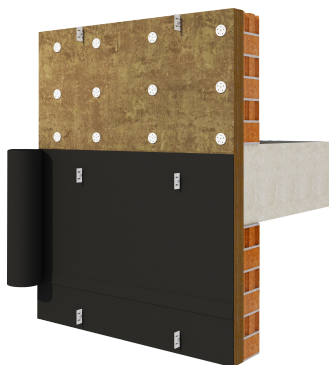
Sistema Rainproof de fachada ventilada