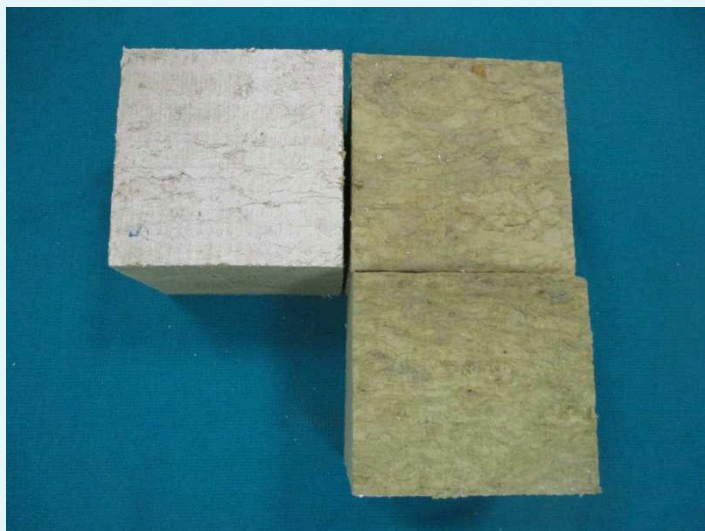
Fotografia di alcuni provini, dall'alto in basso, spessore nominale 80 mm, 120 mm e 180 mm

Photograph of some specimens, from top to bottom, nominal thickness 80 mm, 120 mm and 180 mm.