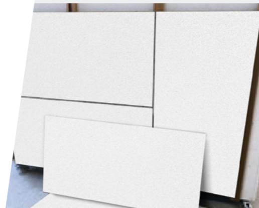
Recyclage des dalles minérales en fin de vie

Marquage : AMF, Armstrong, Knauf CeilingSolutions