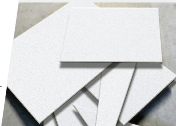
Recyclage des chutes de chantier sur les sites de construction