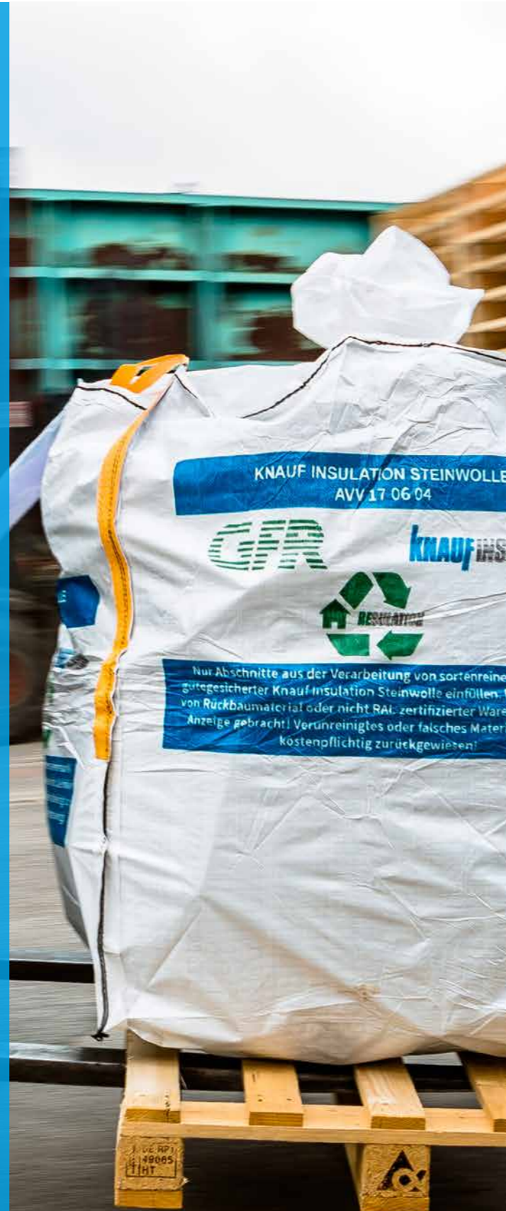
© 2022 Knauf Insulation GmbH KI | Resulation 12./2022 BM

Alle Produktkataloge, Anwendungsbroschüren und Datenblätter finden Sie in unserer App.