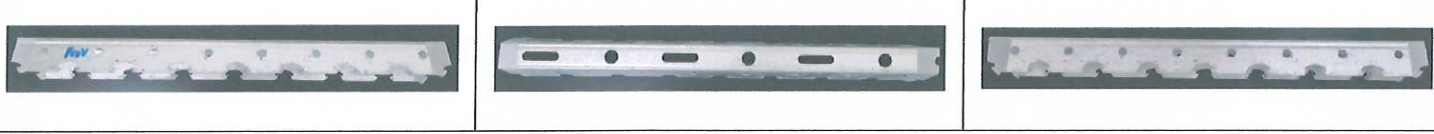
Hình ảnh mẫu thử sau khi phun sương ẩm 96 giờ