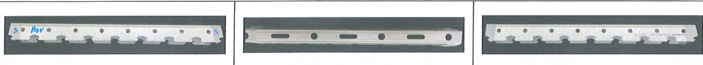
Hình ảnh ban đầu của mẫu thử