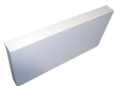
Panneaux KNAUF Therm Th38 SE