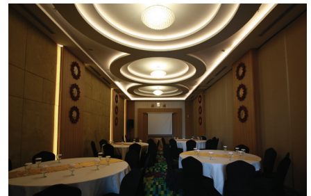
Ibis Style Hotel