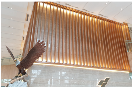
The Residence at St. Regis

Knauf FireShield sangat cocok untuk area pada bangunan seperti hotel, apartment, dan fasilitas umum seperti rumah sakit, pusat perbelanjaan, institusi pendidikan, dan perpustakaan.