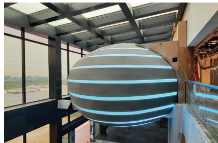
Indokeppel Data Center